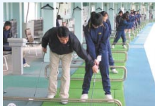
1993年から続いている 中学生向けの体験ゴルフ教室

国内関連会社では、地域行事への参加や寄付活動などを行っています。地域に密着した企業として、従業員全員が社会貢献活動に積極的に参加しています。