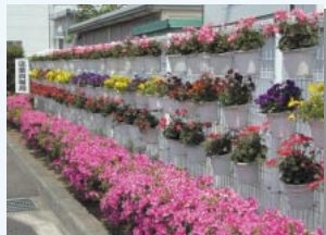
季節ごとに美しい花が咲く ジー・エル・ジーの構内

当社の国内関連会社27社は、ISO14001認証取得活動に限らず、清掃活動や省エネルギー活動など、多岐にわたった環境保全活動を実施しています。