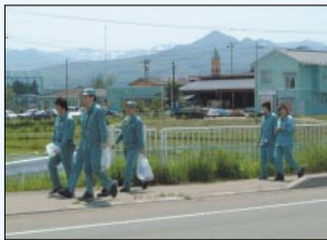
東北日発は従業員全員参加で 事業所周辺のごみ拾いを行う