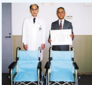
今年は車いす2台を横浜市立大学医学部 付属病院に寄贈