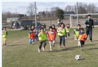
スミハツスプリングカップでは、 幼児のサッカーも行われた