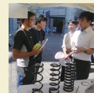
大会では企業PRコーナーに出品し、当社をPR