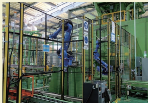
稼働を開始したニッパツ九州