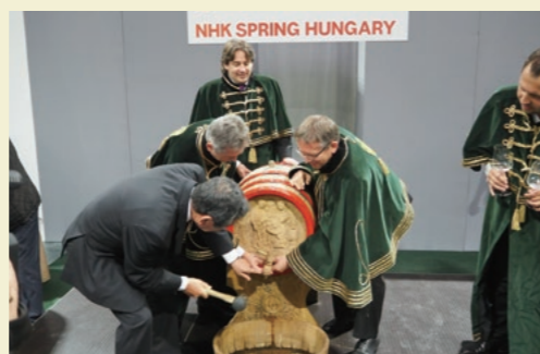
開所式ではワイン騎士団がワイン樽を開栓

2016年9月、ニッパツハンガリーが開所式を行いました。開所式の様子は、テレビや地元誌、官庁のホームページでも紹介され、ニッパツハンガリーへの期待の高さを感じさせました。