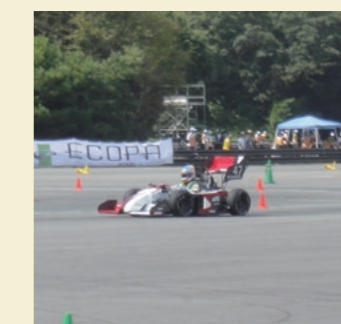
当社提供のばねが搭載された学生自作のクルマ

当社は、毎年9月に開催される自動車技術会主催の「全日本学生フォーミュラ大会」に協賛・支援しています。学生が自作するクルマで競うこのイベントに、大会協賛のほか、各大学からの依頼に基づき、主にダンパー用のばねを無償提供しています。2017年度は、さらに新たな大学からの依頼も受け、これに対応しています。前途有望な学生の活動を積極的に支援しています。