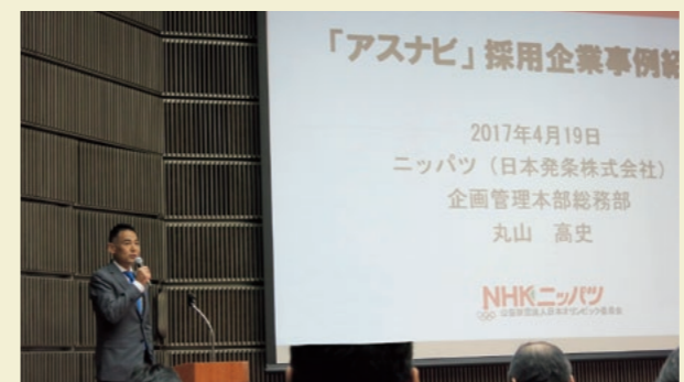
アスナビ採用企業事例発表

※当社所属選手を「ニッパツアスリートサイト」で紹介しています。 http://nhkspg-athlete.com/