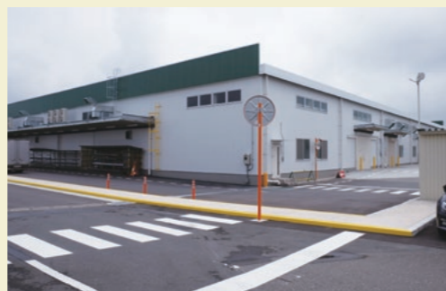
完成した新ウレタン棟

群馬工場の新ウレタン棟が完成し、2016年6月、竣工式を行いました。工場再構築にともない、ウレタン生産の新ラインも敷設しました。品質および生産性のさらなる向上につながるものと期待されます。