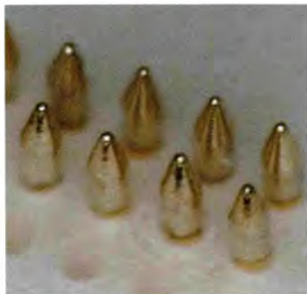
Probe detail Diameter: 0.14mm Min. Pitch: 0.20mm